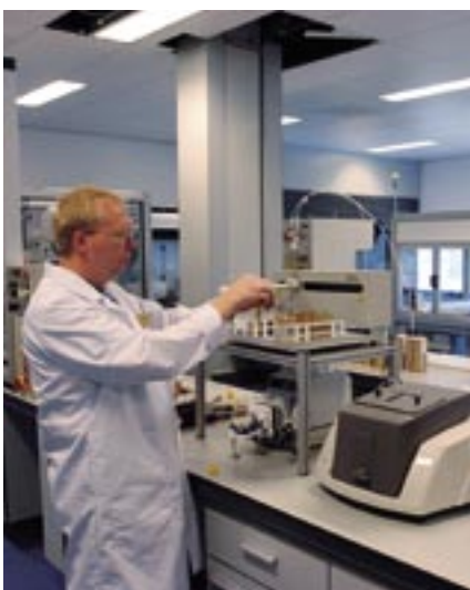
S.O.S.-lab voor smeerolie analyses

Om de beschikbaarheid van installaties te garanderen heeft Pon Power een aantal service en service support faciliteiten ondergebracht in een Customer Service Centre. Klanten kunnen hier een bezoek brengen aan de werkplaats waar hun motor gereviseerd wordt, getuige zijn van het testen van de motor op de dubbele proefstand of deelnemen aan een training om motorkennis bij te spijkeren. Overige diensten zoals het smeerolie-lab, de kalibratie- en brandstofsyste­men afdeling en het uitgebreide onderdelenmagazijn zijn ook gehuisvest in het Customer Service Centre.