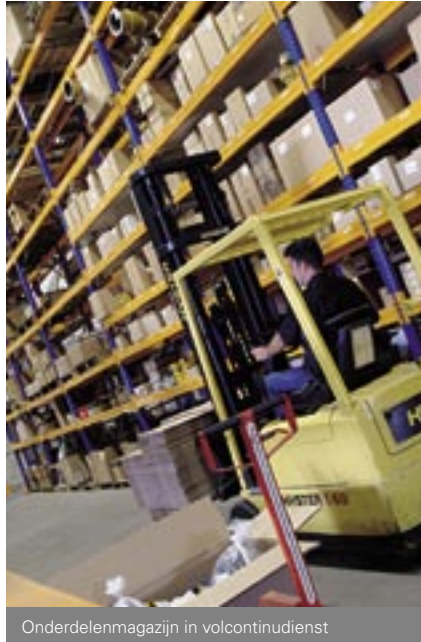
Onderdelenmagazijn in volcontinuïensdienst