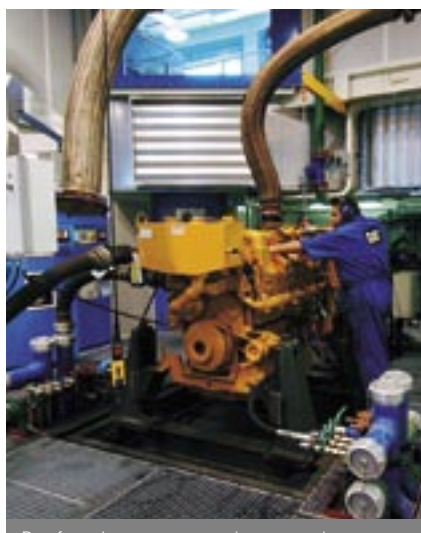
Proefstand met twee testruimten voor het proefdraaien van motoren tot 3300 kW