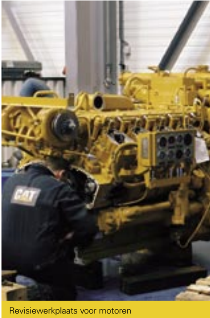
Revisiewerkplaats voor motoren