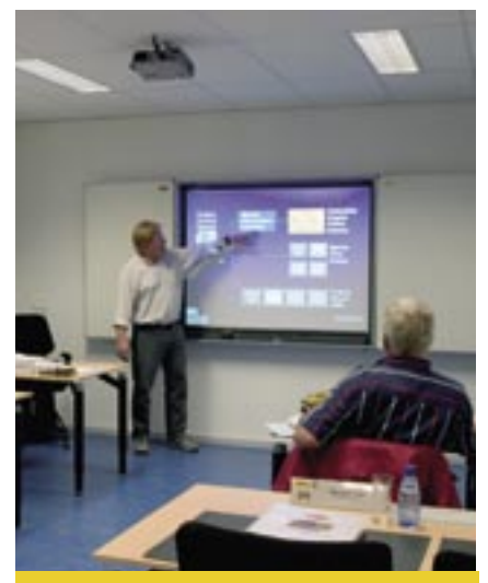
Het trainingscentrum biedt training en opleiding op maat