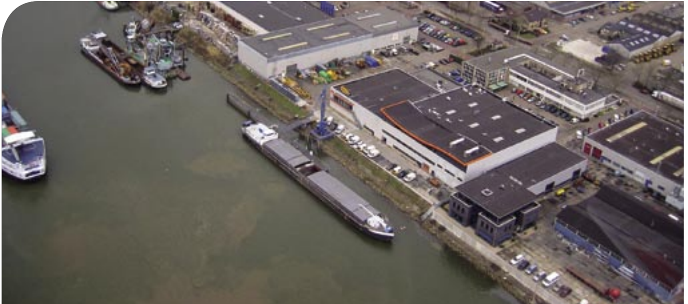
Schippers kunnen voor inspectie of onderhoud aanmeren bij Pon Power in Papendrecht